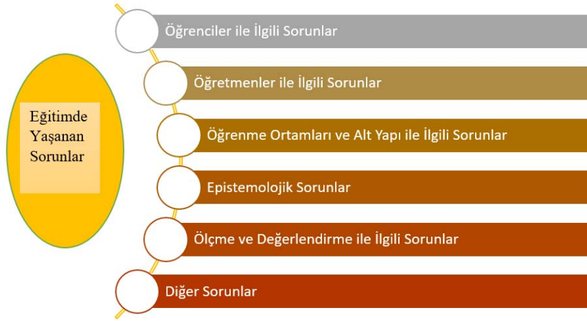
Şekil 1. Eğitimde Yaşanan Sorunlar

Öğretmen adaylarıyla yapılan görüşmelerin analizi sonucunda, katılımcıların eğitimde yaşanan sorunları; “öğrenciler ile ilgili sorunlar”, “öğretmenler ile ilgili sorunlar”, “öğrenme ortamları ve altyapı ile ilgili sorunlar”, “epistemolojik sorunlar”, “sınav ile ilgili sorunlar” ve “diğer sorunlar” olmak üzere altı tema altında ifade ettikleri gözlemlenmiştir (Şekil 1). Katılımcıların elde edilen bu sorunları bazı kurum, model, öğretim stratejileri veya öğretim ilkeleri ile bağlantılı olarak verdikleri tespit edilmiştir.