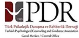
Türk PDR Derneği