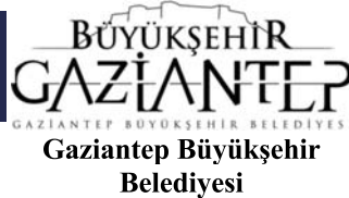
Gaziantep Büyükşehir Belediyesi

V. Uluslararası TURKCESS Eğitim ve Sosyal Bilimler Kongresi TUBİTAK tarafından desteklenmektedir.