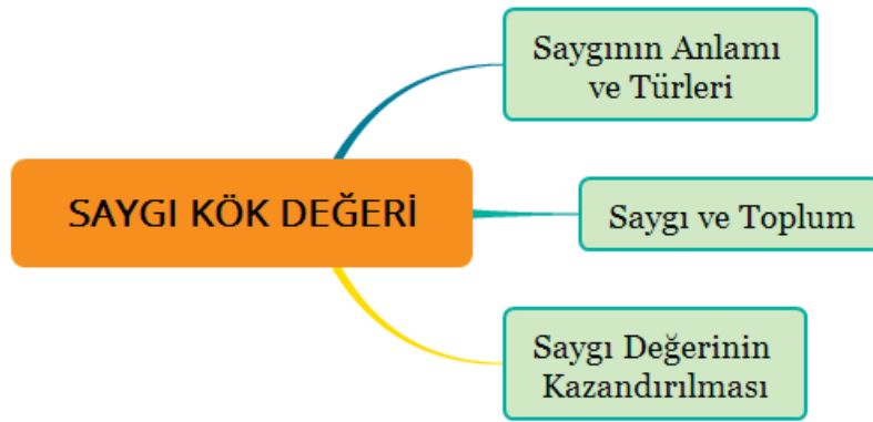
Şekil 1. Saygı kök değeri temaları

Elde edilen bulgulara göre saygı kök değeri hakkında sınıf öğretmenlerinin; 3 tema, 8 kategori altında 77 koddan oluşan 179 söylem dile getirdikleri görülmektedir. Belirtilen bu 3 tema: Saygının anlamı ve türleri , Saygı ve toplum , Saygı değerinin kazandırılması şeklinde sıralanmış ve temalara ait model Şekil 1'de sunulmuştur.