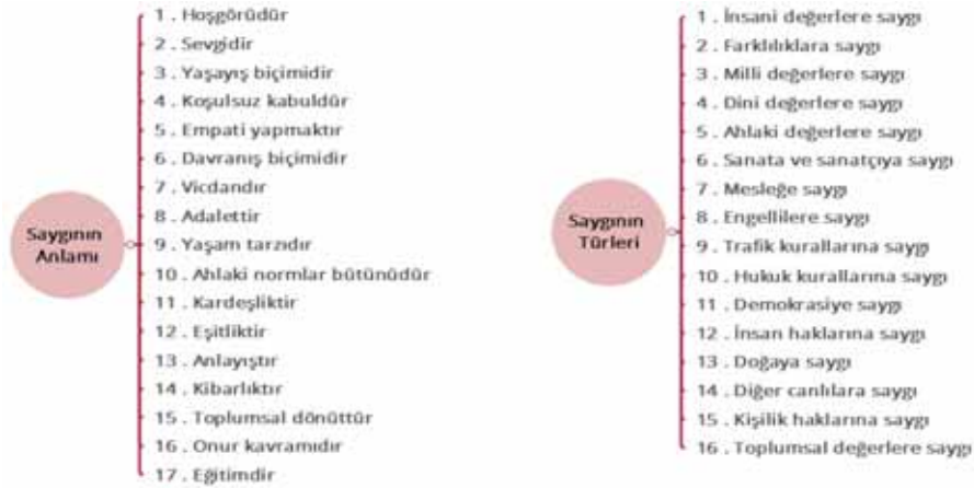
Şekil 3. Saygının anlamı ve Saygının alt kavramları kategorilerinin oluşturduğu kodlar

Sınıf öğretmenlerinin saygı kök değeri hakkındaki görüşleri incelendiğinde oluşan 8 kategori için 77 kod içeren 179 söylem dile getirdiği görülmektedir. Bu söylemlerden oluşan Saygının anlamı ve Saygının türleri kategorilerine ait kodların modeli Şekil 3’te sunulmuştur.