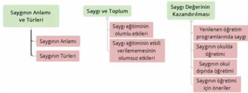
Şekil 2. Saygı kök değeri kategorileri

Saygının anlamı ve türleri teması; “Saygının anlamı” ve “Saygı türleri” kategorileri, Saygı ve toplum teması; “Saygı eğitiminin olumlu etkileri” ve “Saygı eğitiminin etkili verilememesinin olumsuz etkileri” kategorileri, Saygı değerinin kazandırılması teması ise; “Saygının okulda öğretimi”, “Saygının okul dışında öğretimi”, “Yenilenen öğretim programlarında saygı” ve “Saygının öğretimi için öneriler” kategorileri şeklinde sıralanmış ve kategorilere ait model Şekil 2’de sunulmuştur.