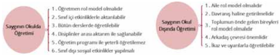
Şekil 5. Saygının okulda öğretimi ve Saygının okul dışında öğretimi kategorilerinin oluşturduğu kodlar

Sınıf öğretmenlerinin söylemleri ile oluşan Yenilenen öğretim programlarında saygı ve Saygının okulda öğretimi kategorilerine ait kodların modeli Şekil 5’te sunulmuştur.