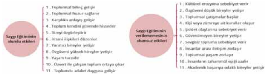
Şekil 4. Saygı eğitiminin olumlu etkileri ve Saygı eğitiminin verilememesinin olumsuz etkileri kategorilerinin oluşturduğu kodlar

Sınıf öğretmenlerinin söylemleri ile oluşan Saygı eğitiminin olumlu etkileri ve Saygı eğitiminin verilememesinin olumsuz etkileri kategorilerine ait kodların modeli Şekil 4’de sunulmuştur.